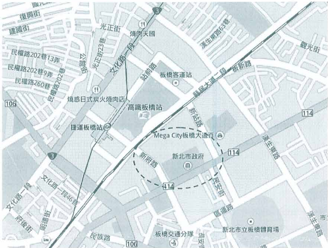
圖 2：新北市政府周邊地圖