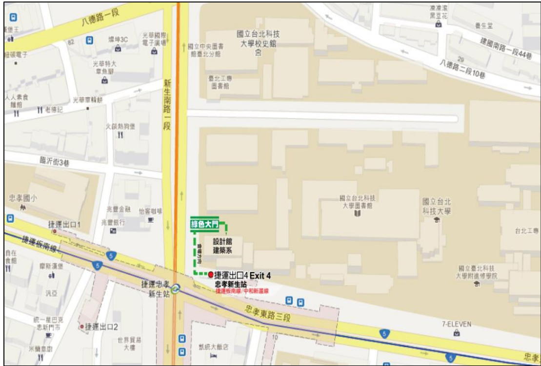
2015 舊建築物性能診斷及整維修繕實務研討會-交通路線圖